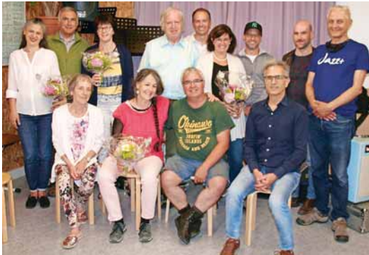
Auf den Bildern sind Kolleginnen und Kollegen, die ihr Jubiläum in den Jahren 2020 oder 2021 feierten.