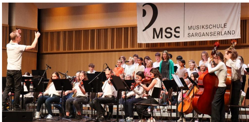
Kinderchor Sing.Punkt und Pop-Rock-Klassik Orchester am Jahreskonzert 2023

Mit dem Sing.Punkt soll die Freude an der Musik und am Gesang erweckt werden.